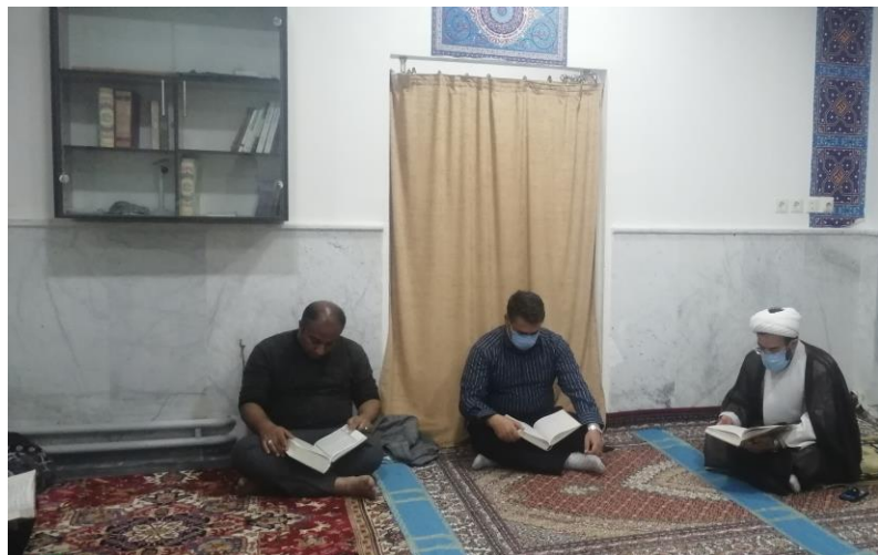
۲- برگزاری محافل جزء خوانی و تفسیر قران کریم و اقامه نماز جماعت در ایام ماه مبارک رمضان در ستاد شبکه بهداشت و درمان شهرستان اسکو